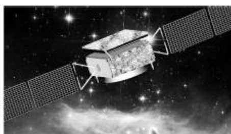
图 1.1 图标题